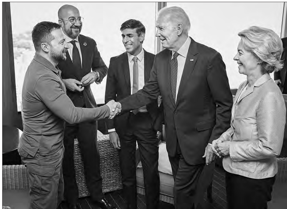
Президент України Володимир Зеленський, Президент Європейської Ради Шарль Мішель, Прем'єр-міністр Великої Британії Ріші Сунак, Президент США Джо Байден та Президентка Єврокомісії Урсула фон дер Ляєн (зліва направо).

Також Володимир Зеленський провів двосторонні зустрічі з Прем'єр-міністром Великої Британії Ріші Сунаком, Президентом Франції Емманує-