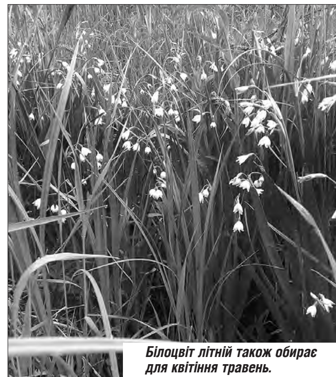
Білоцвіт літній також обирає для квітіння травень.