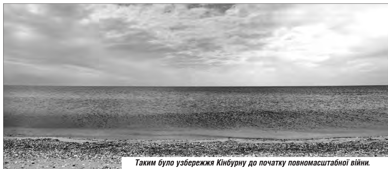
Таким було узбережжя Кінбурну до початку повномасштабної війни.

Олена ІВАШКО. Миколаївська область.