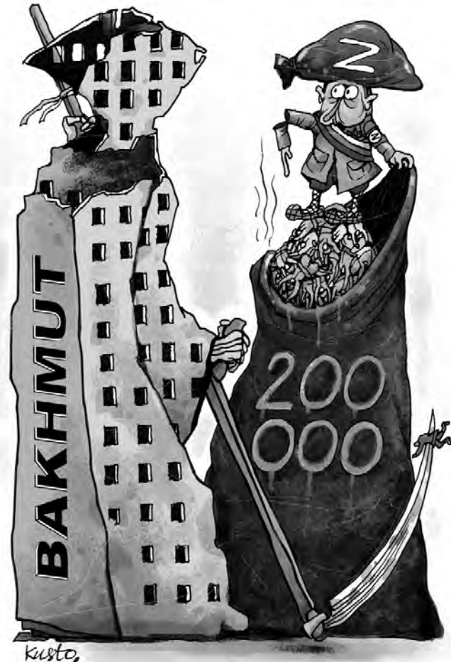
З понад 200 тисяч знищених окупантів в Україні втрати росії у боях за Бахмут перевищують 100 тисяч осіб.