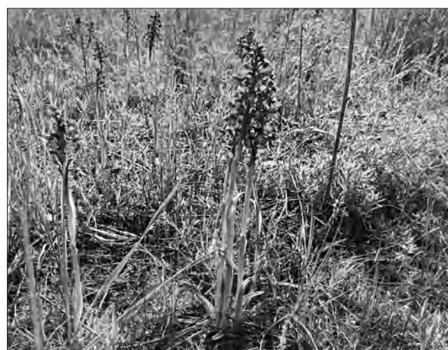
На Кінбурнській косі розквітли дикі орхідеї.

журналістами побували років 20 тому. Враження були неймовірні. Відомо, що орхідея має аромат ванілі. А коли сотні цих запашних квітів колишуться від подиху морського кінбурнського вітерцю, в повітрі просто зависають ті ванільні пахощі. Відтоді щороку в травні намагалася побувати на Кінбурні саме під час цвітіння диких орхідей. Це стало своєрідною традицією для мене та багатьох друзів. Адже саме в травні коса завоює своєю чистотою та прозорим морським повітрям, буянням рослин, лагідним сонечком.